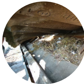
Nest onder pannen Huiszwaluw, spreeuw, gierzwaluw