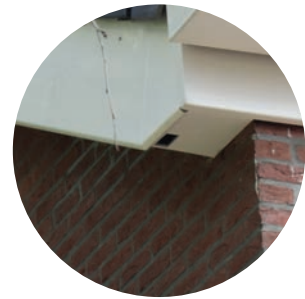
Nestkast achter boeiboord Gierzwaluw