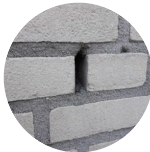
Open stootvoeg Vleermuis