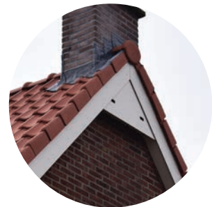
Nestkast achter betimmering in nok gierzwaluw