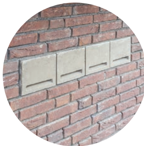
Vleermuiskast in muur Vleermuis