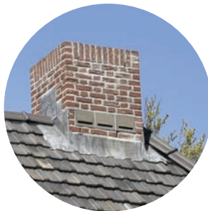
Vleermuiskast in schoorsteen Vleermuis