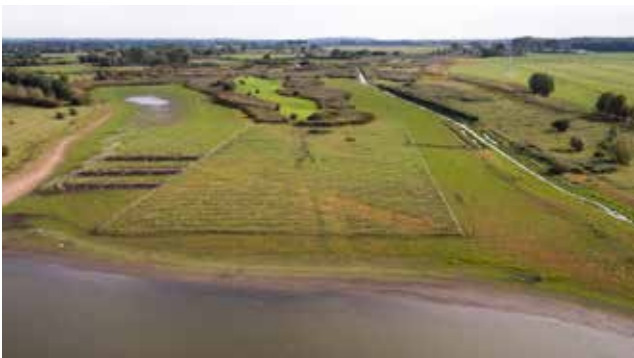
Rijnstrangen met gepland riet, de rasters en linten beschermen tegen ganzenvraat, luchtfoto Stefan Kuiper | SK Production.

In de Rijnstrangen werken Provincie Gelderland en Staatsbosbeheer aan een robuust moerasstelsel voor bijzondere vogelsoorten als grote karekiet en roerdomp. Lees hoe ze dat doen in het artikel van Theo Wijers, Staatsbosbeheer; Frans Smeding, Smeding Advies en Teun Spek, Provincie Gelderland op Nature Today: https://www.naturetoday.com/intl/nl/nature-reports/message/?msg=27434