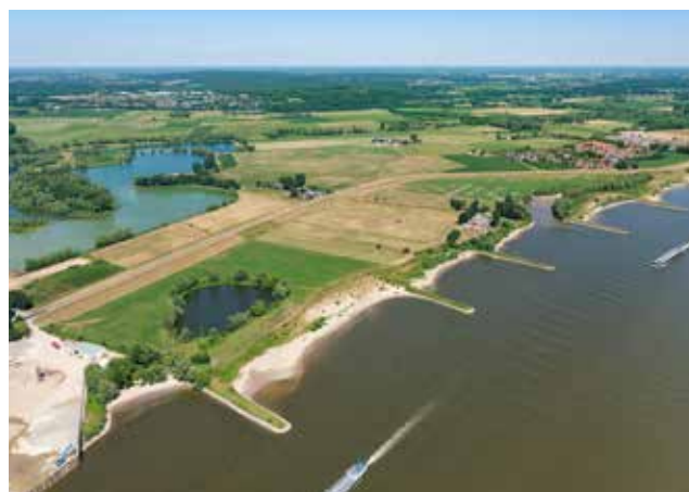
Archief foto van het gebied waar de overnachtingshaven komt, foto The Flying Dutchmen.

Eind februari zijn de voorbereidende werkzaamheden voor de aanleg van de overnachtingshaven Spijk gestart. Aan de rand van Spijk biedt die haven over een paar jaar plaats aan circa 50 binnenvaartschepen. De afgelopen maanden zijn alle bomen en struiken in het gebied verwijderd. Een aantal gekapte bomen komt terug langs de Rijn tussen de kribben om de ecologische diversiteit van het gebied te verbeteren. De andere bomen en struiken gingen naar Staatsbosbeheer. Het gebied is inmiddels afgezet, zodat aannemer Boskalis straks veilig kan werken.