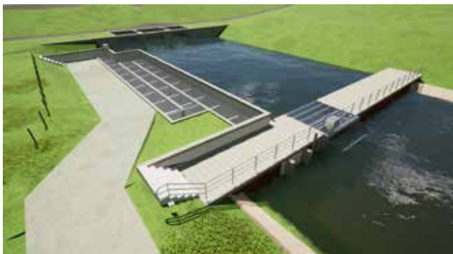
Visualisatie vispassage Kandia.

De vispassage is onderdeel van het Waterakkoord Blauw Knooppunt. Hierin trekken Rijkswaterstaat en Waterschap Rijn en IJssel gezamenlijk op om de grote rivieren met regionale watersystemen te verbinden. Met de komst van deze vispassage kunnen vissen de binnenwateren van het hele stroomgebied van de Rijnstrangen tot in Duitsland bereiken.