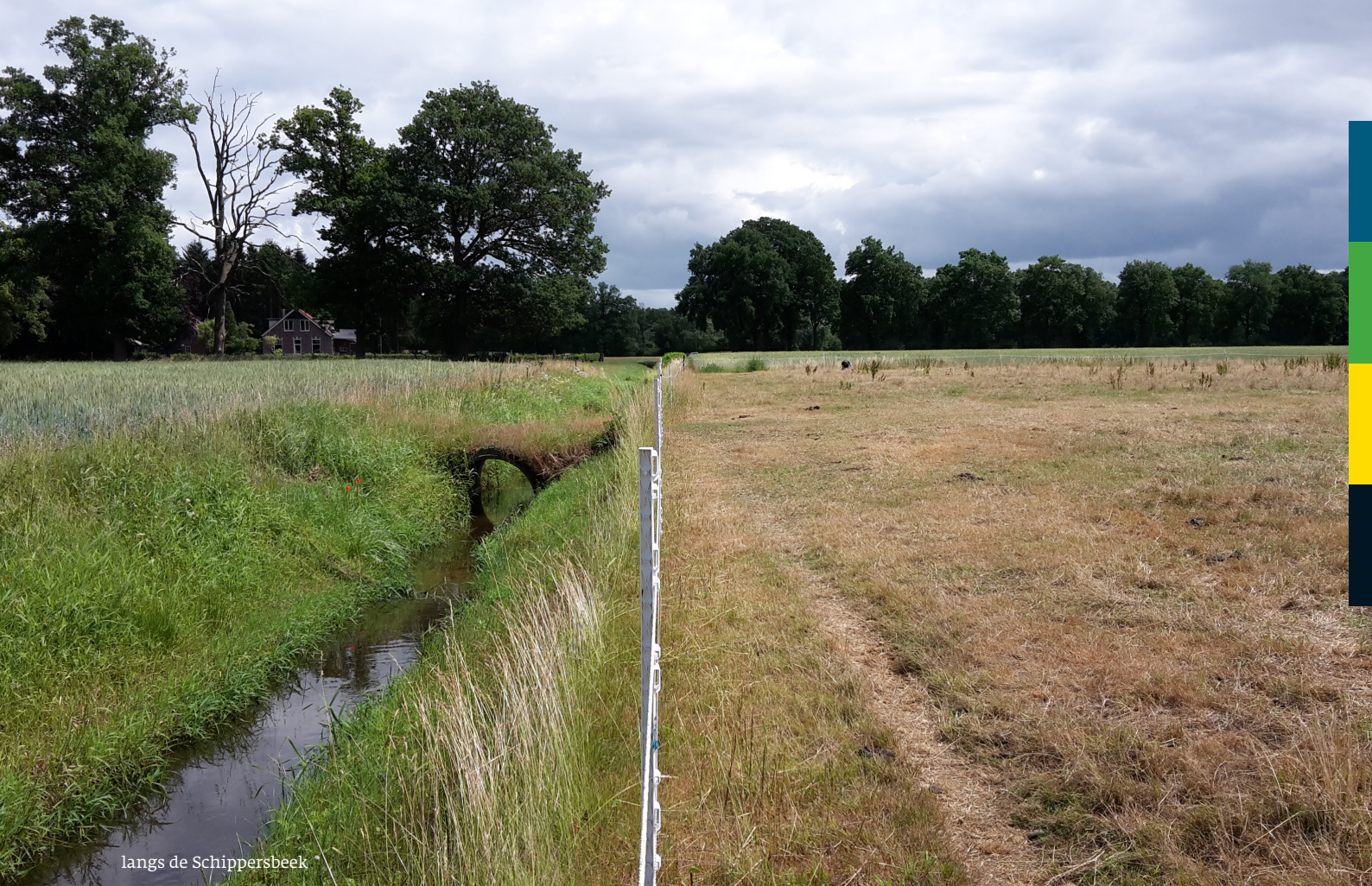
langs de Schippersbeek