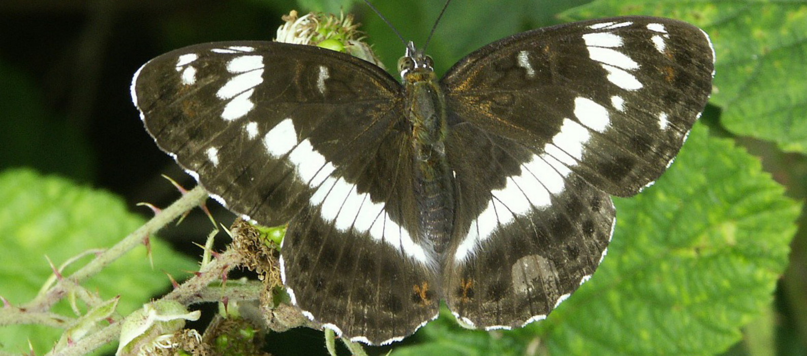
Kleine ijsvogelvlinder