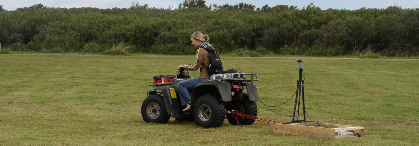
Voorbeeld van een meting met 300 MHz grondradar achter een quad en de gammaspectrometer achterop de quad.