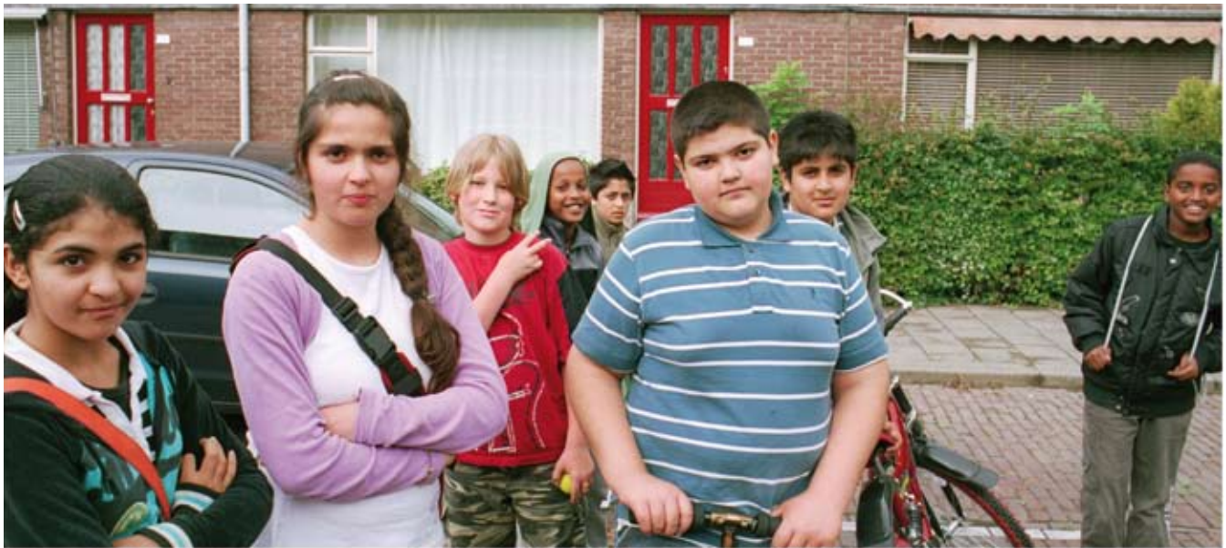
Woonwijk Presikhaaf in Arnhem

arbeidsmarkt. Er is een migranten-middenklasse aan het ontstaan.