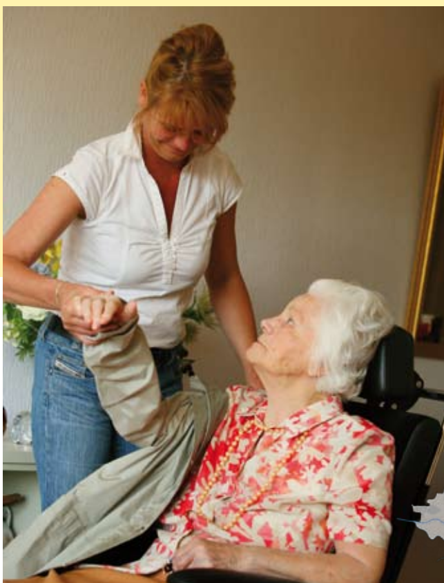
Thuiszorg Maas en Waal

Plots wordt iemand uit je naaste omgeving ziek en kan niet meer zonder dagelijkse zorg. Als je echtgenoot dementeert bijvoorbeeld. Of na een hersenbloeding een persoonlijkheidsverandering heeft ondergaan. "Veel