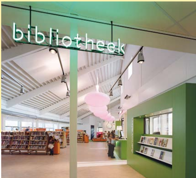
Bibliotheek in kulturhus Beek