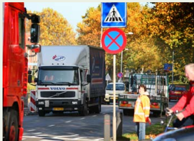
Doorgaand verkeer geeft overlast in de kern van Voorthuizen. Een rondweg zorgt voor een duurzame oplossing.

In 2003 besloot de provincie Gelderland om de rondweg aan te leggen. Na de inspraak op de startnotitie startte een milieueffectonderzoek naar drie tracés: één ten westen en twee ten oosten van de bebouwde kom. Alle tracés lossen de huidige en toekomstige problemen op. In de Barneveldse politiek waren veel voorstanders van een oostelijke variant in combinatie met een nieuwe aansluiting op de snelweg. Dat laatste bleek echter niet haalbaar. Bovendien is een oostelijke omleiding duurder dan een westelijke omleiding. Daarom spraken de Gelderse Provinciale Staten in hun coalitieakkoord van 2007 een voorlopige voorkeur uit voor de westelijke omleiding.