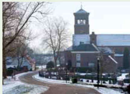
Deest, dijk van een dorp

De directeur van Alphons Ariëns vindt dat zijn woningstichting een bredere taak heeft dan het aanbieden van woningen. 'Het gaat mij om mensen en niet om stenen. Wij staan voor gezonde